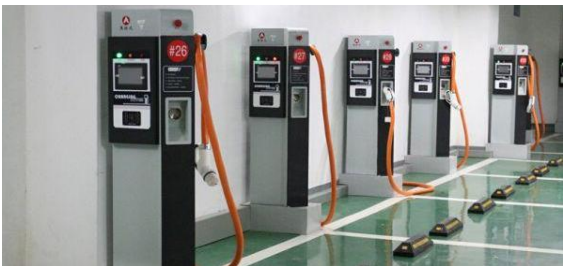
公共停车场设置充电桩

公共停车场数量： 配备公共停车场1处以上，人均公共停车场面积达到0.8平方米以上。公共停车场应设置充电桩。