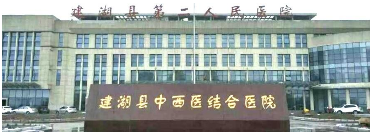
建湖县第二人民医院（二级综合，上冈镇，县域东部医疗、预防服务中心，7个病区，200张床位）

千人床位数： 卫生院床位规模按本镇常住人口加暂住人口、加上级卫生行政主管部门划定的辐射乡镇人口的1/3计算。每千服务人口宜设置1.8张床位以上。