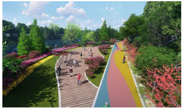
海绵城市设计示意