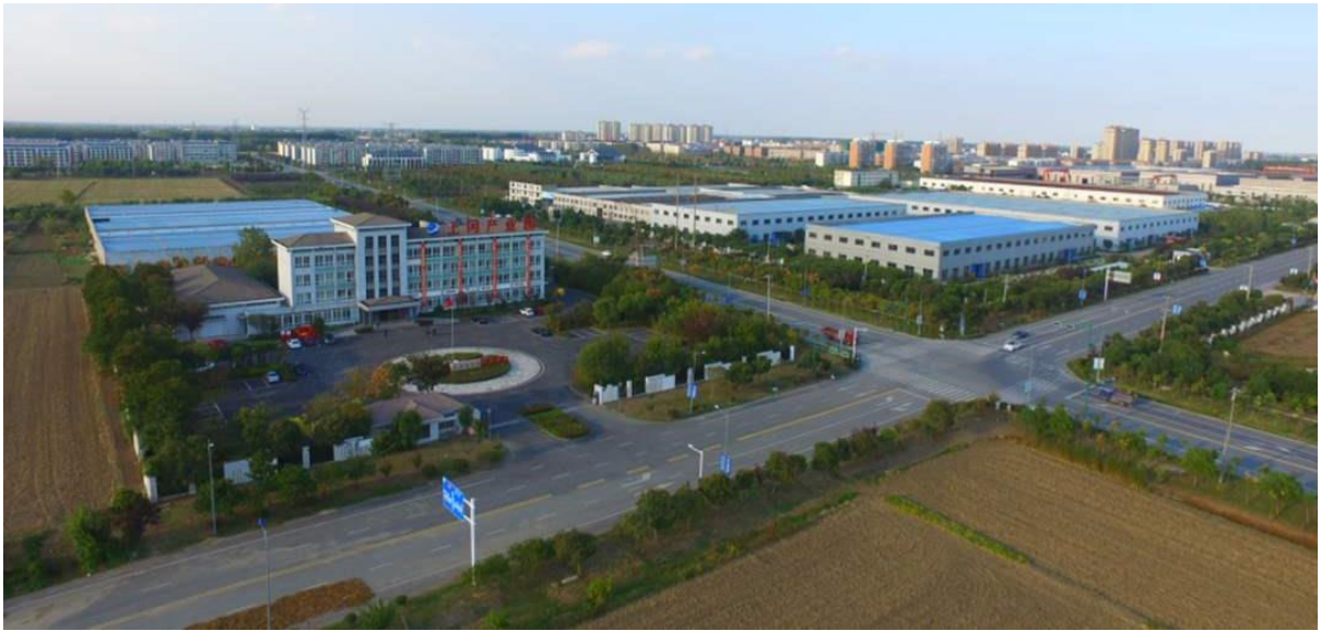
上冈镇（建成区面积：11.56平方公里；建成区常住人口规模：8.69万人）