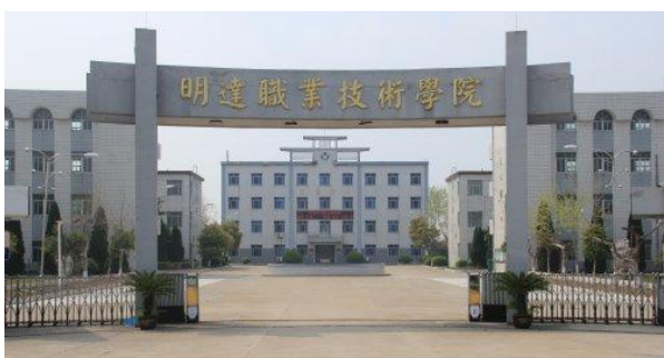
明达职业技术学院（海通镇）

高中数量： 鼓励3万人以上的小城镇建设一处星级高中、中等专业学校或者职业学校，形成区域教育服务中心。